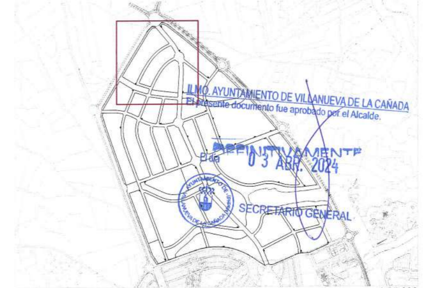
Plano de situación