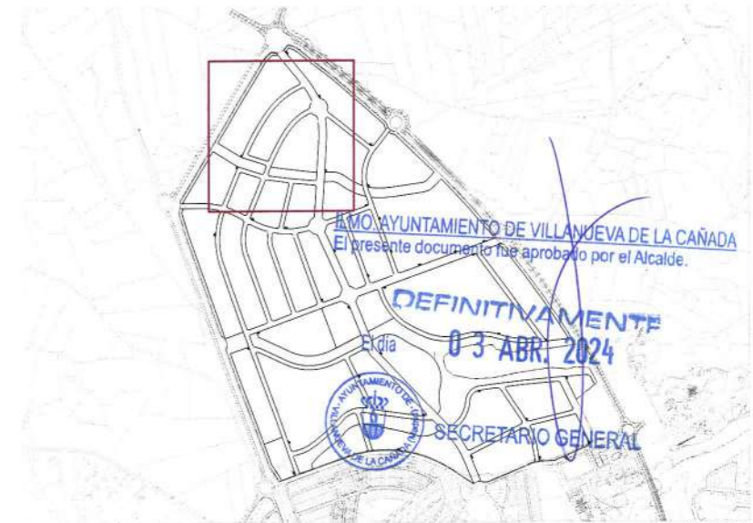
Plano de situacion