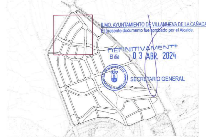
Plano de situación