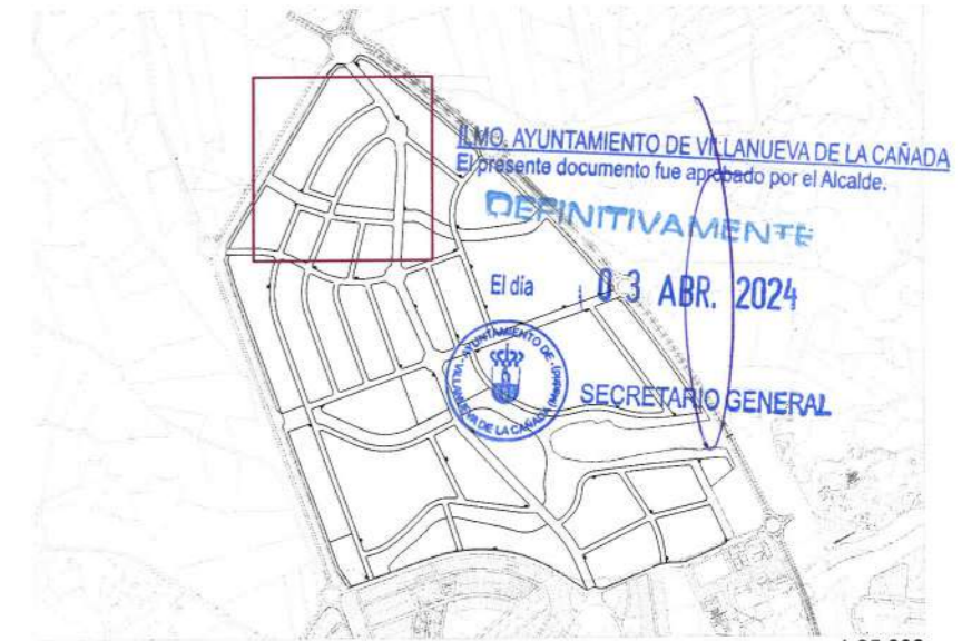
Plano de situación