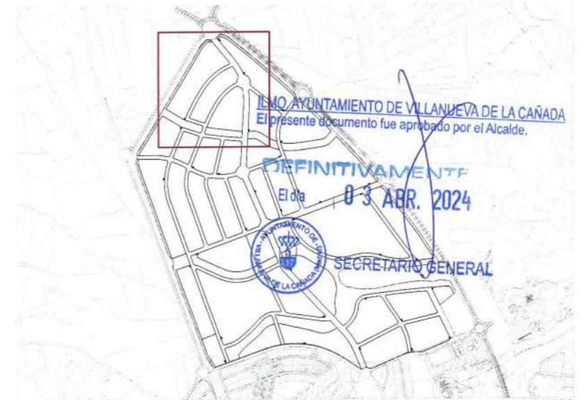
Plano de situación