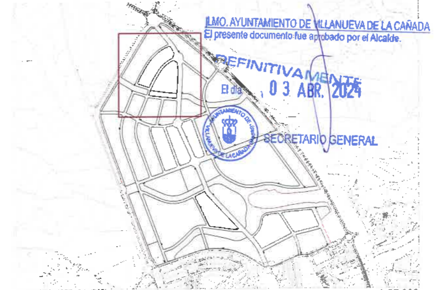
Plano de situación