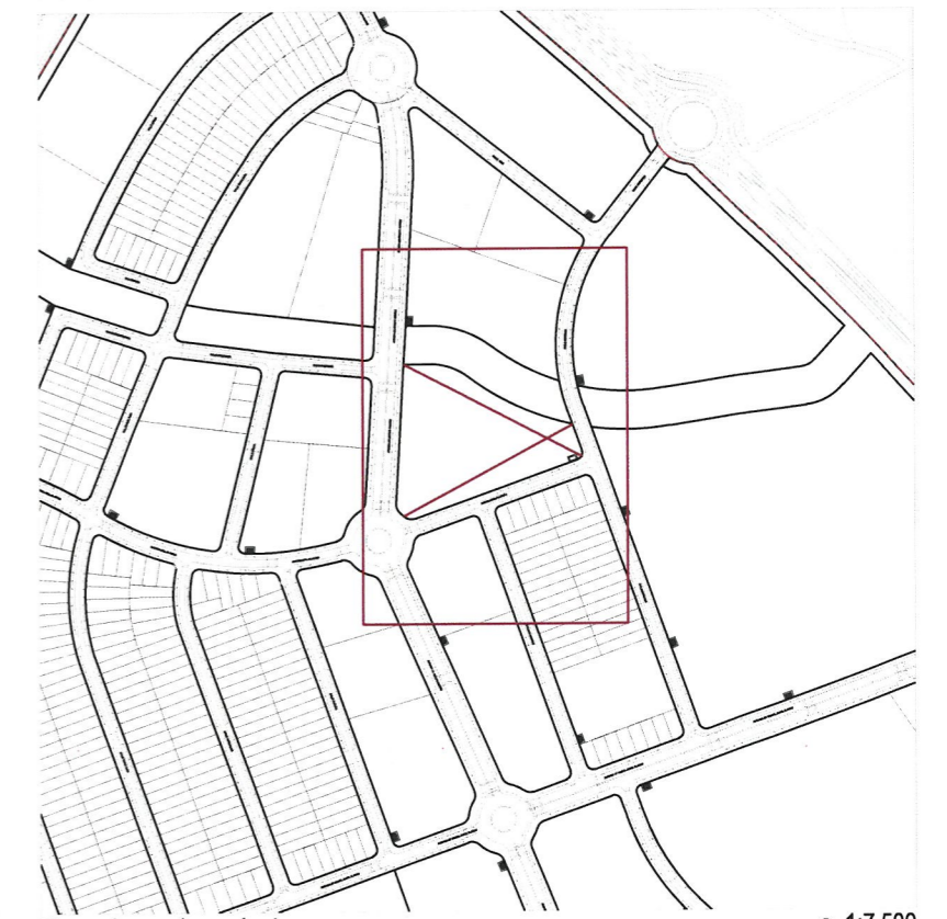
Plano de emplazamiento