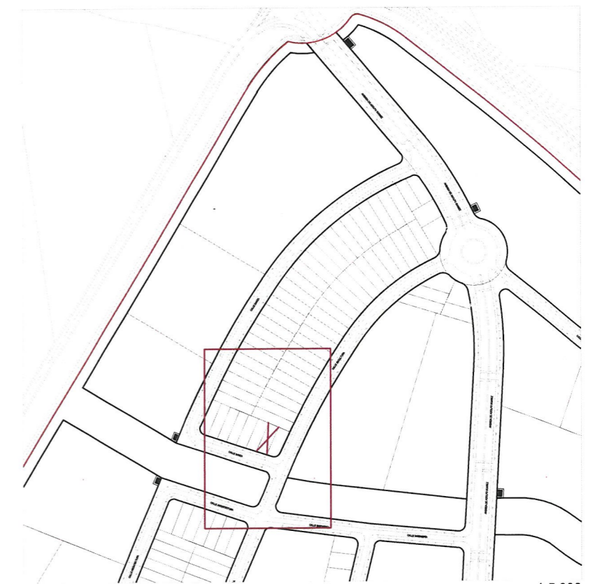
e. 1:250 Plano de emplazamiento