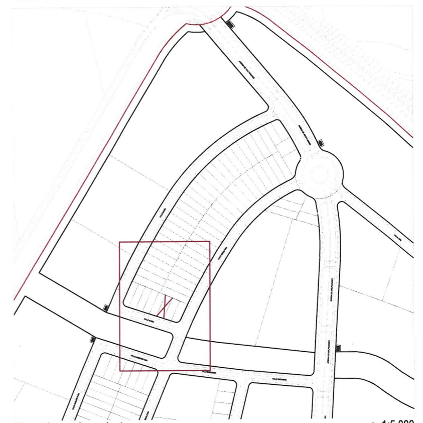
Plano de emplazamiento