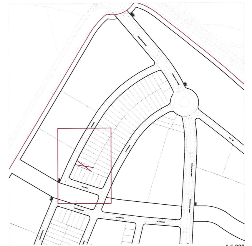
Plano de emplazamiento