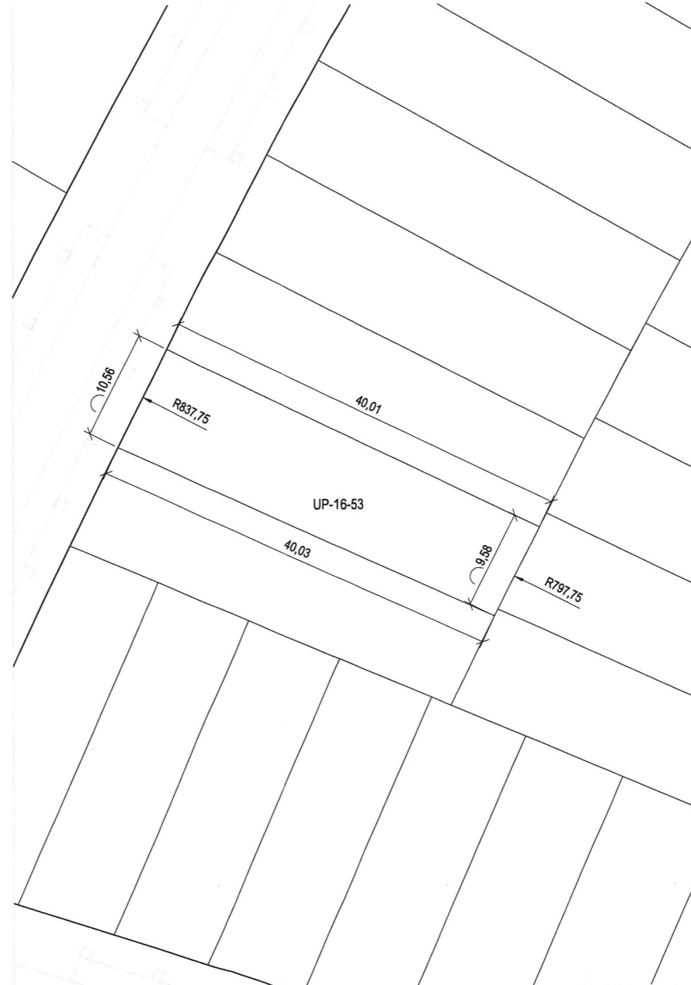
Plano de definición de la parcela