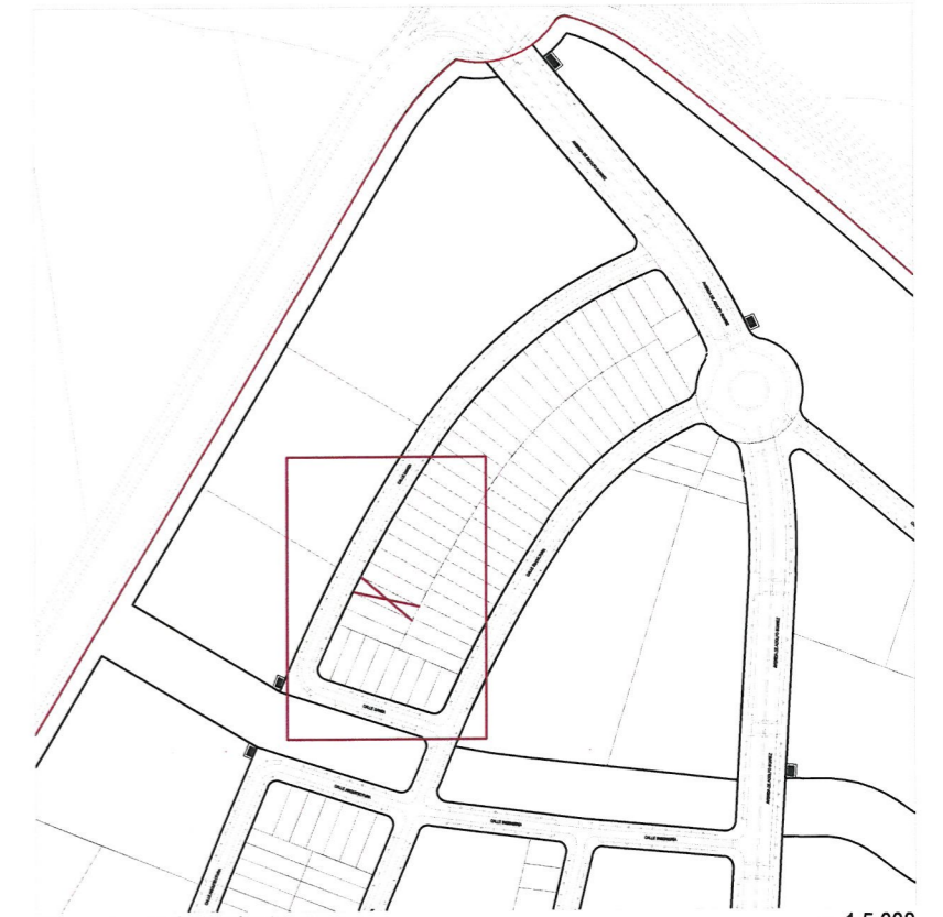
Plano de emplazamiento