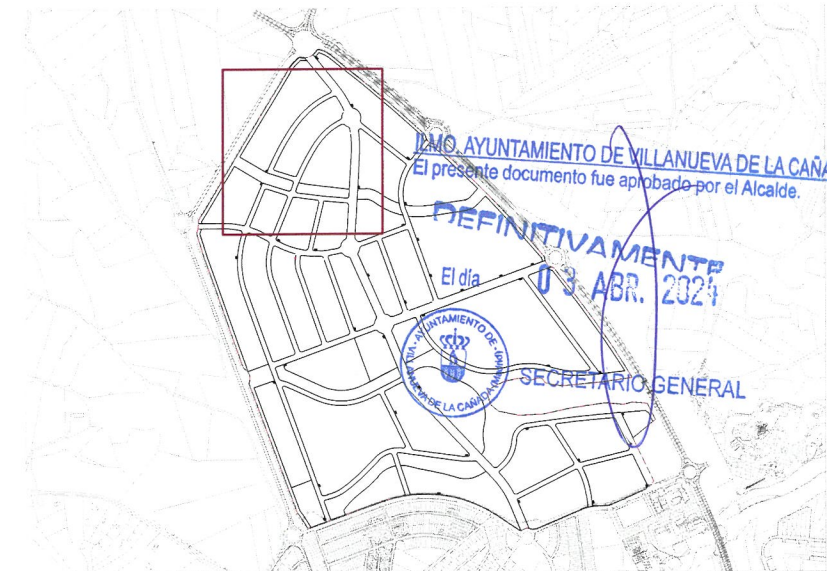
Plano de situación