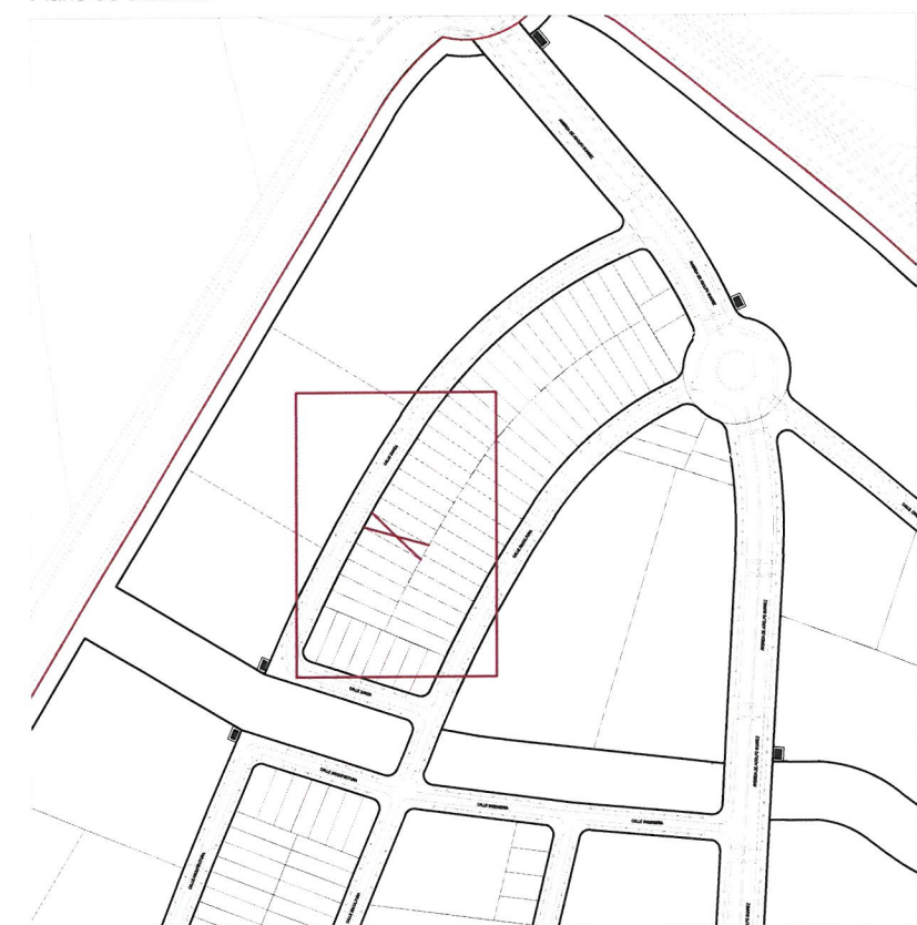
Plano de emplazamiento