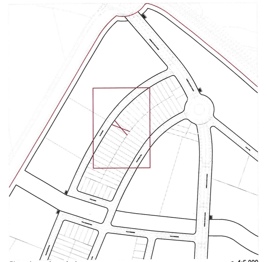
Plano de emplazamiento