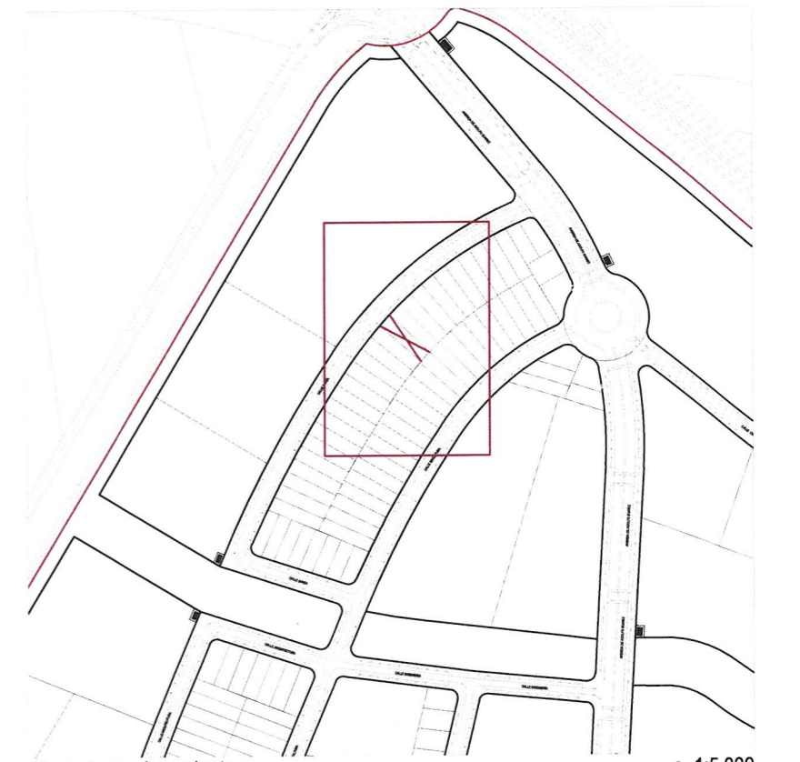
Plano de emplazamiento