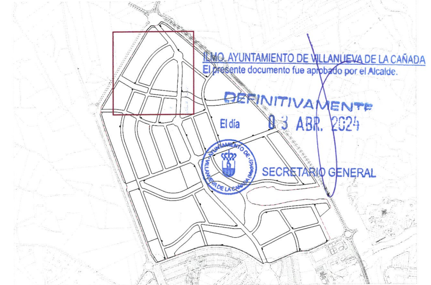
Plano de situación e. 1:25.000