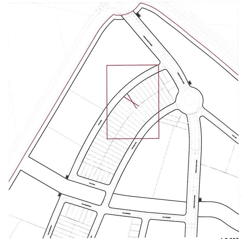
Plano de emplazamiento e. 1:5.000