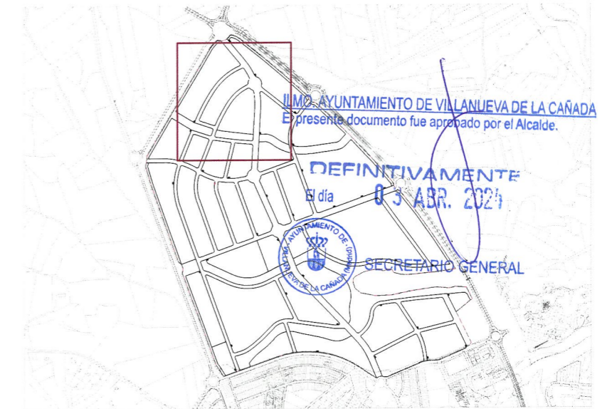
Plano de situación