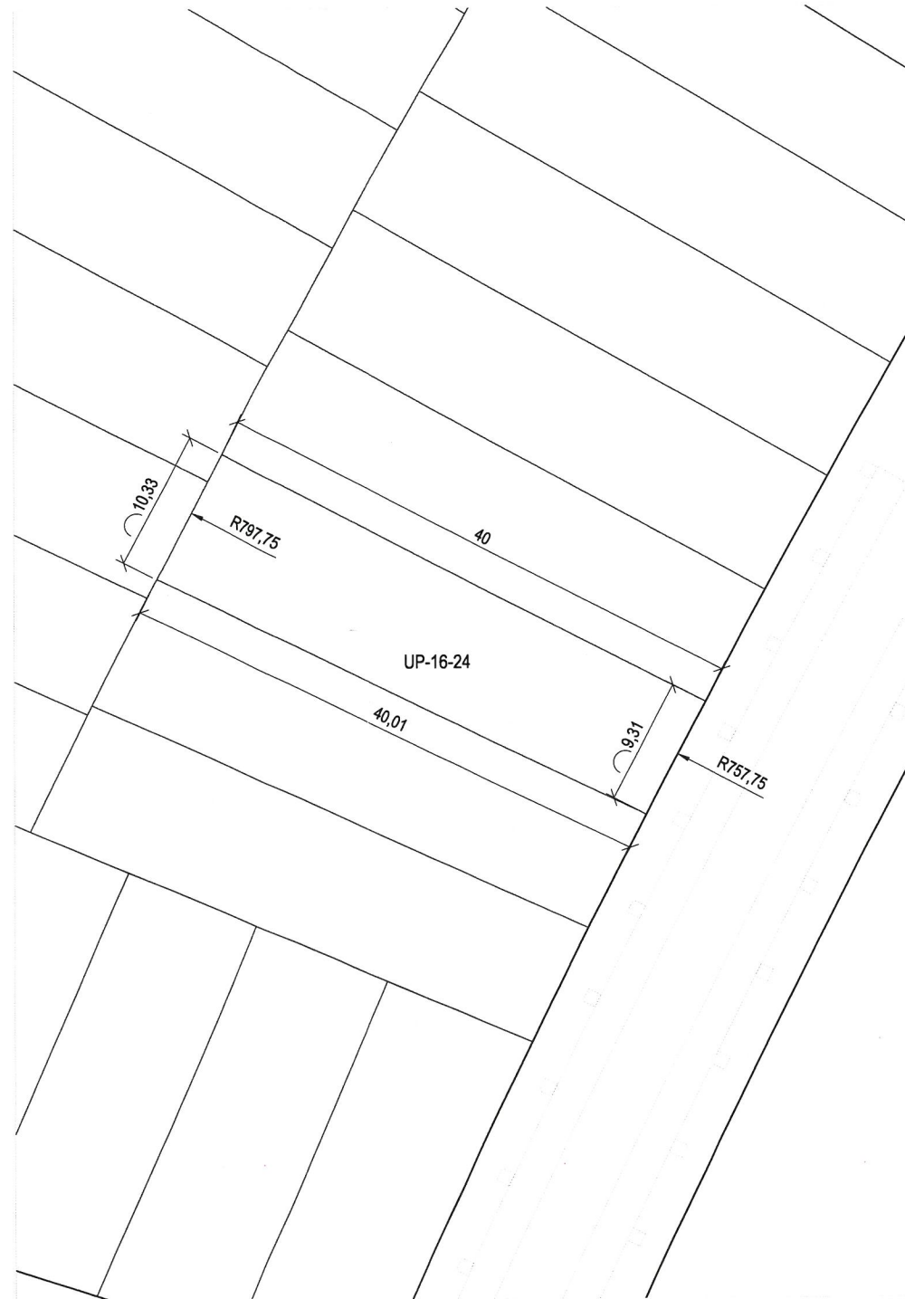
Plano de definición de la parcela