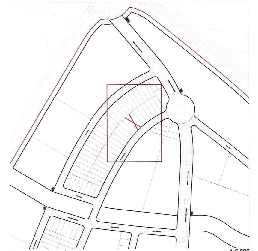
Plano de emplazamiento