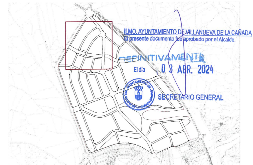
Plano de situación