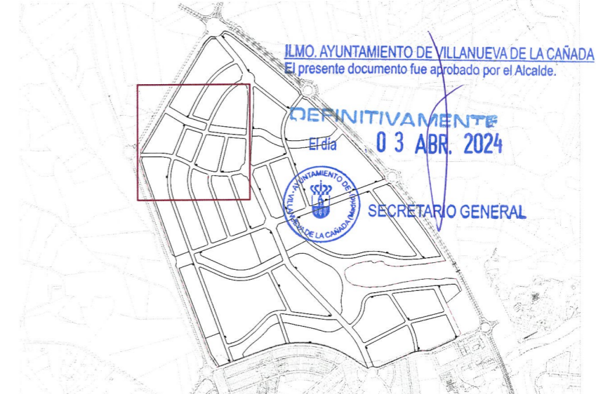
Plano de situación e. 1:25.000