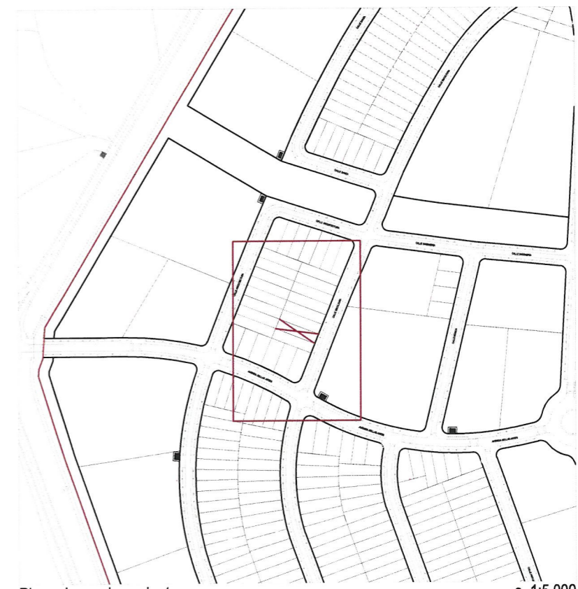
Plano de emplazamiento e. 1:5.000

AYUNTAMIENTO DE VILLANUEVA DE LA CAÑADA El presente documento fue aprobado por el Alcalde. DEFINITIVAMENTE El día 03 ABR. 2024 SECRETARIO GENERAL