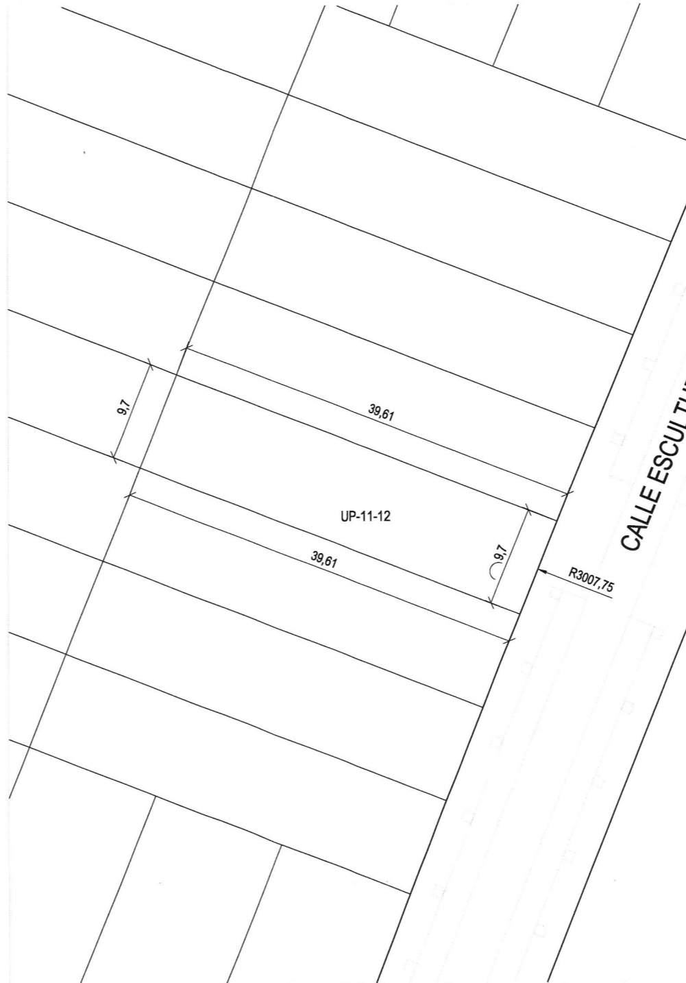
Plano de definición de la parcela