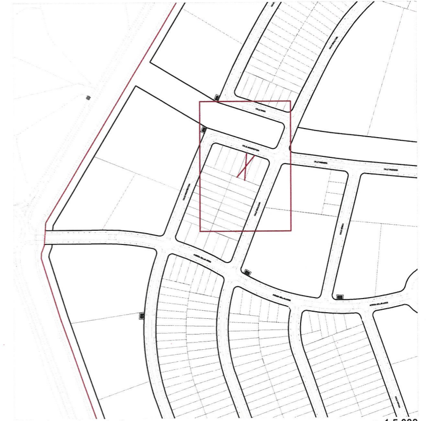
Plano de emplazamiento e. 1:5.000