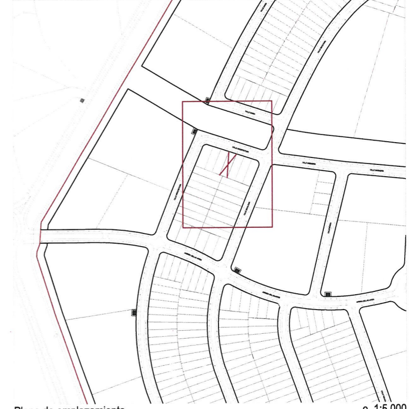
Plano de emplazamiento e. 1:5.000