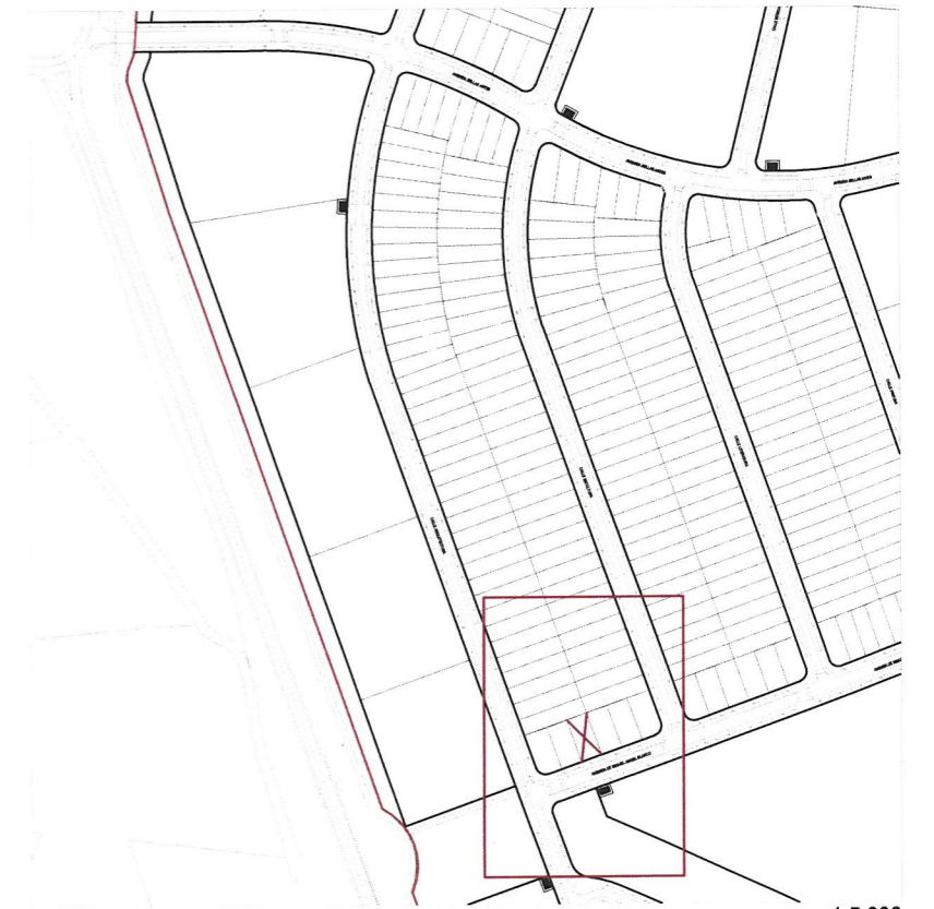
Plano de emplazamiento