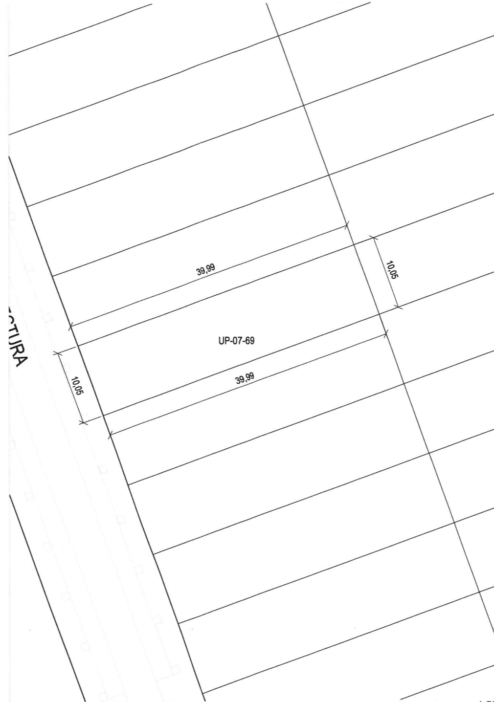
Plano de definición de la parcela