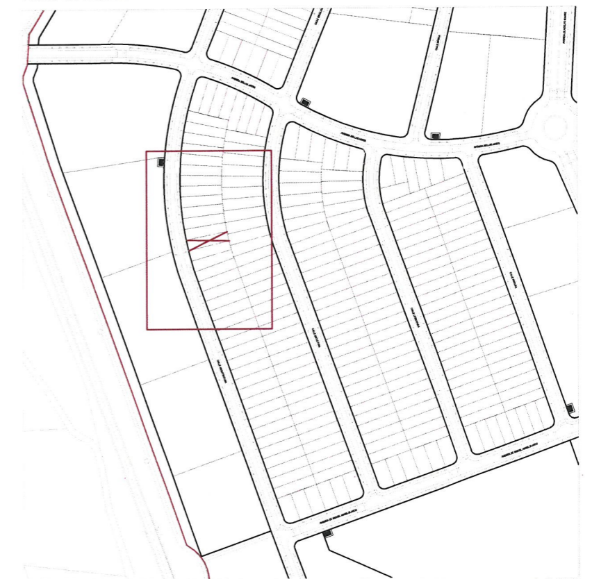
Plano de emplazamiento