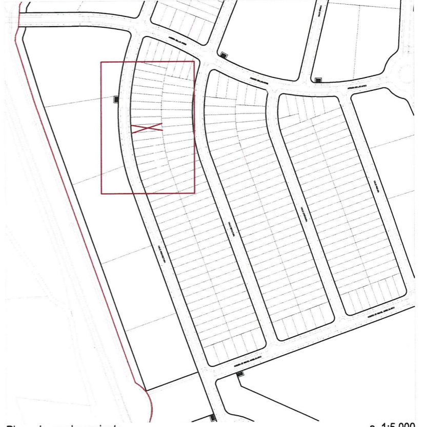
Plano de emplazamiento