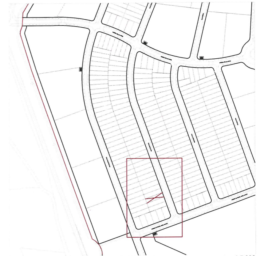
e. 1:500 Plano de emplazamiento