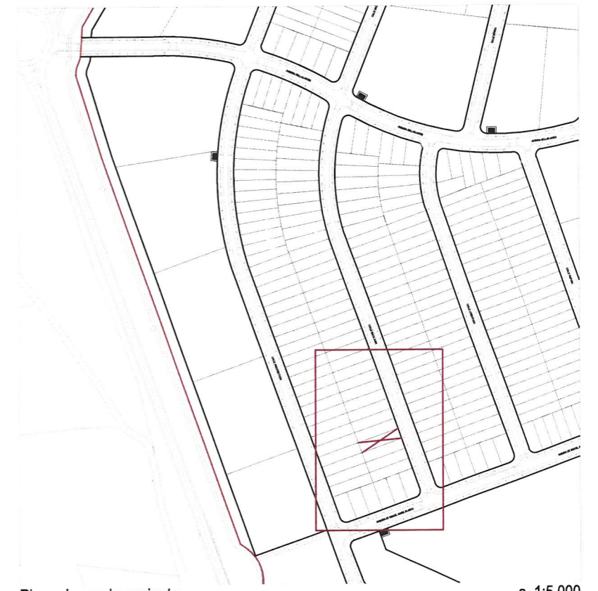
e. 1:500 Plano de emplazamiento