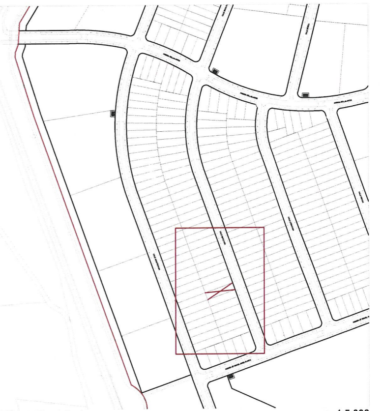
Plano de emplazamiento