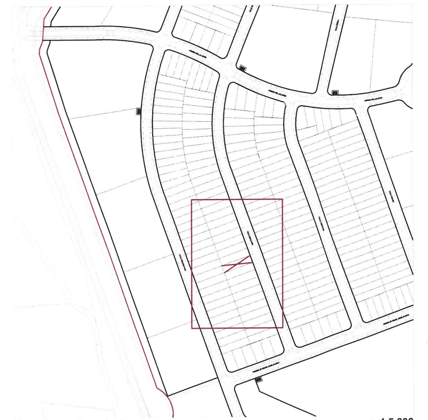
Plano de emplazamiento