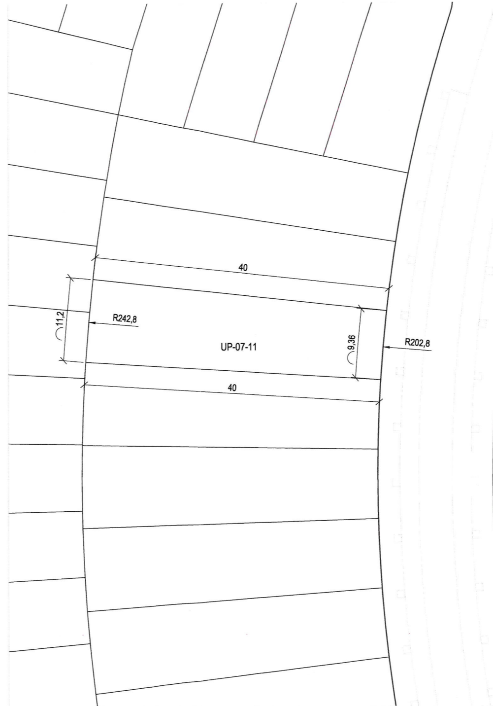
Plano de definición de la parcela