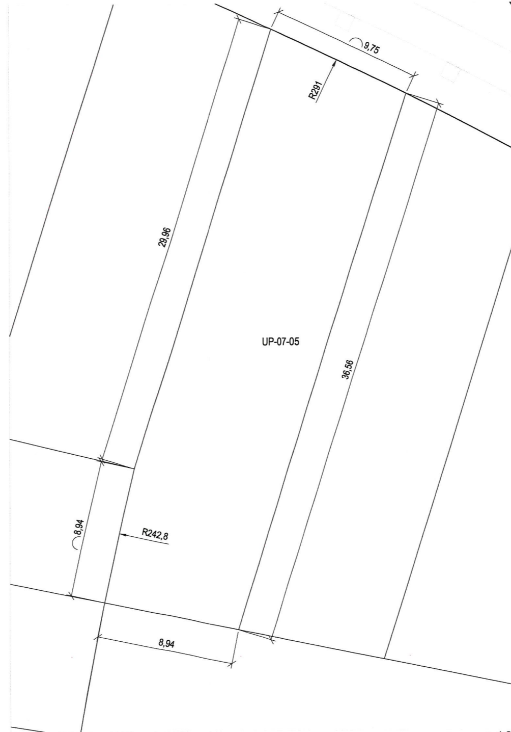
Plano de definición de la parcela