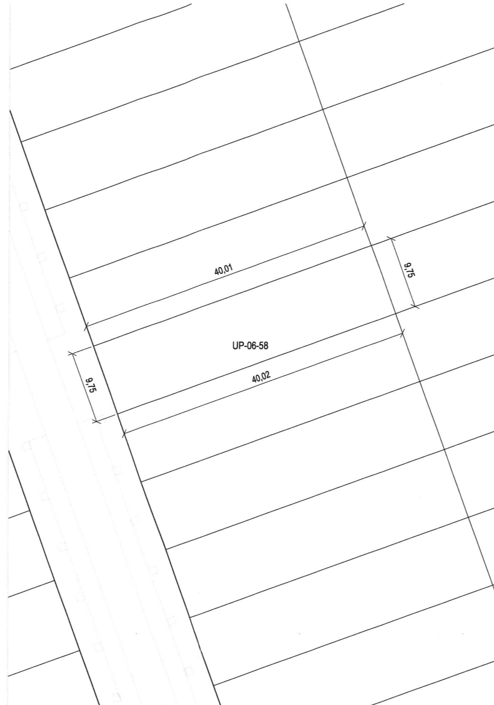
Plano de definición de la parcela