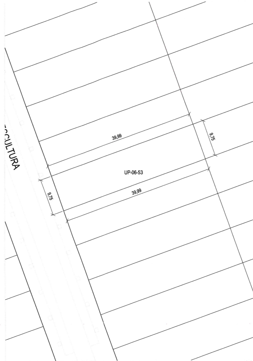
Plano de definición de la parcela