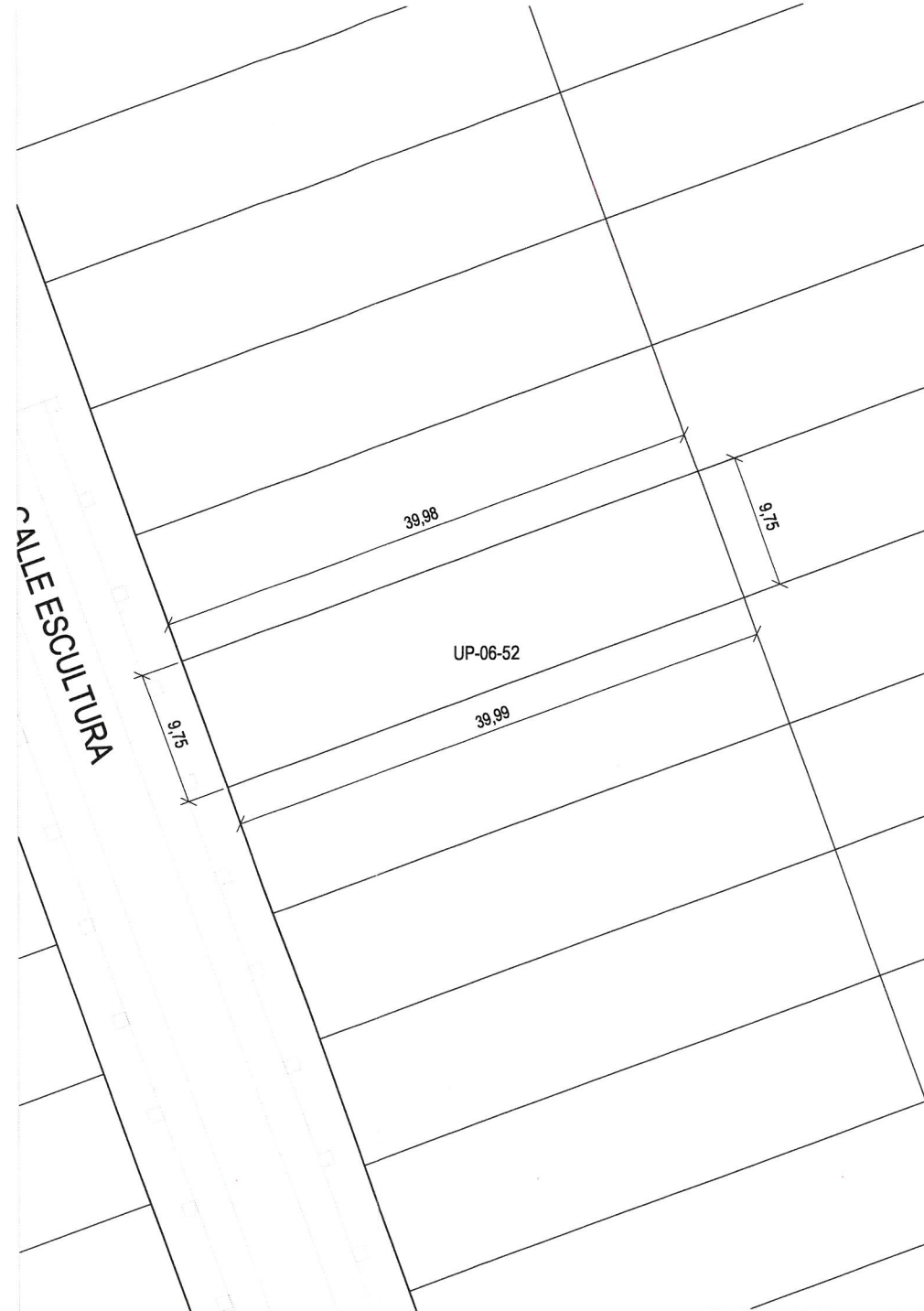
Plano de definición de la parcela