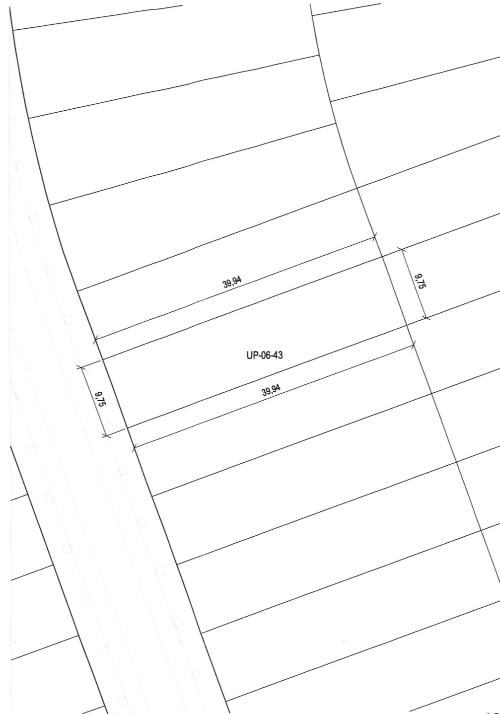
Plano de definición de la parcela