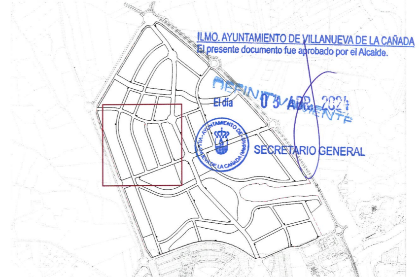
Plano de situacion