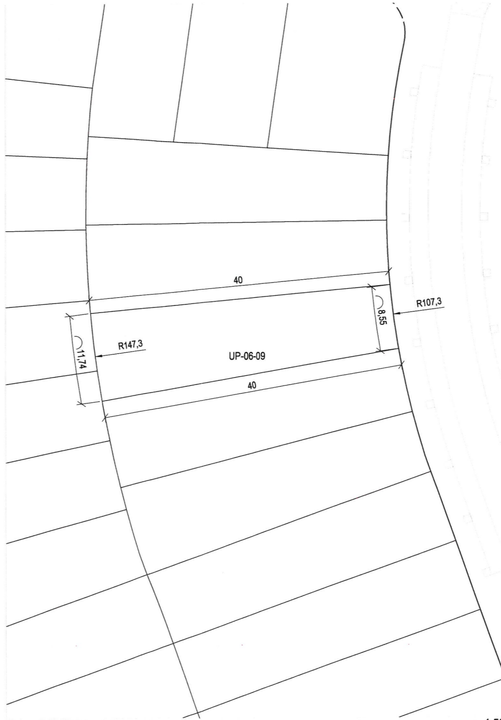
Plano de definición de la parcela