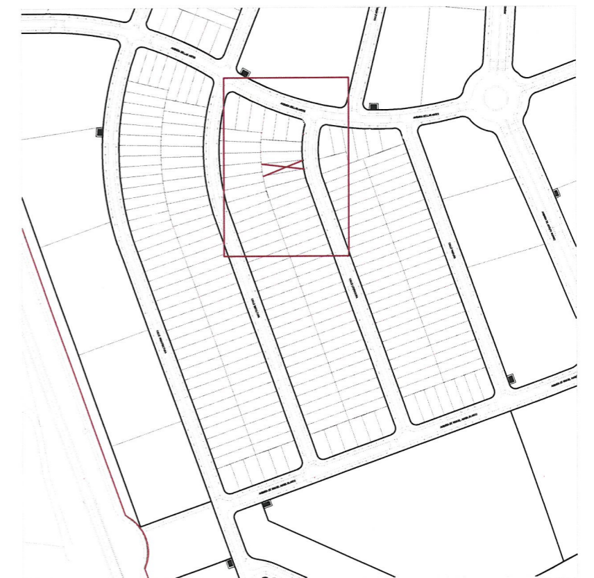
Plano de emplazamiento