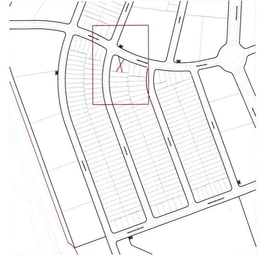
Plano de emplazamiento e. 1:5.000

ILMO. AYUNTAMIENTO DE VILLANUEVA DE LA CAÑADA El presente documento fue aprobado por el Alcalde.