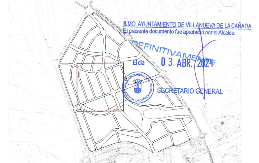
Plano de situación e. 1:25.000