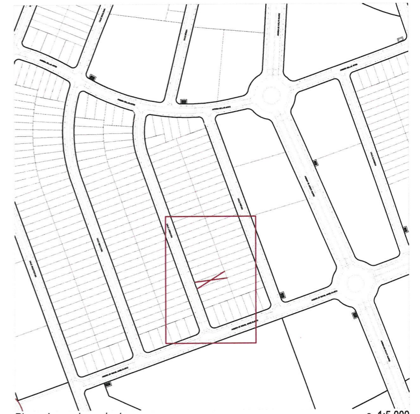
Plano de emplazamiento