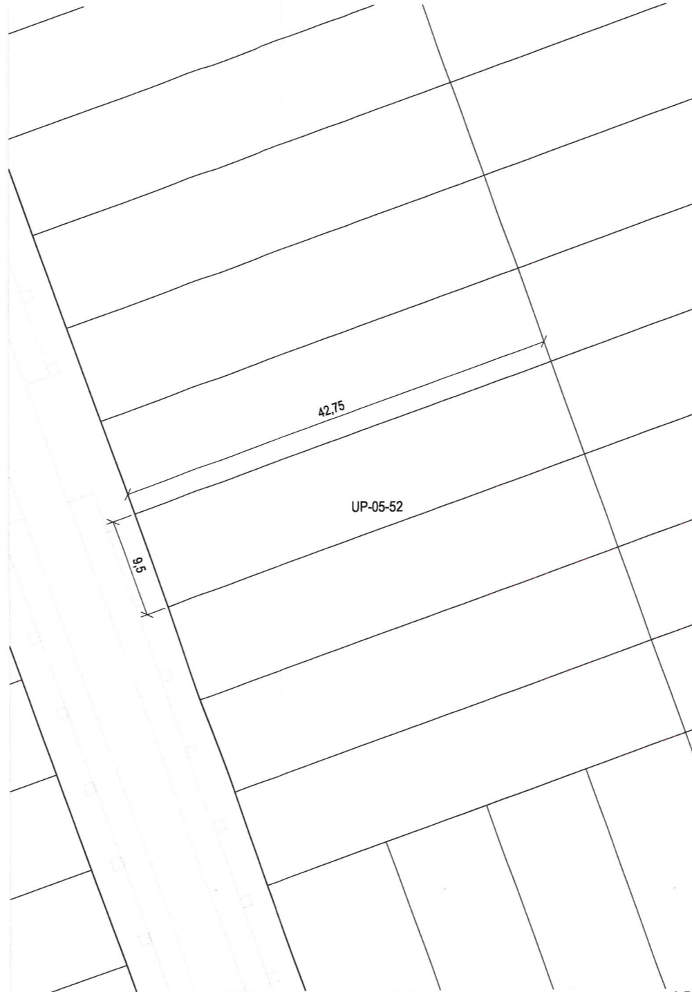
Plano de definición de la parcela