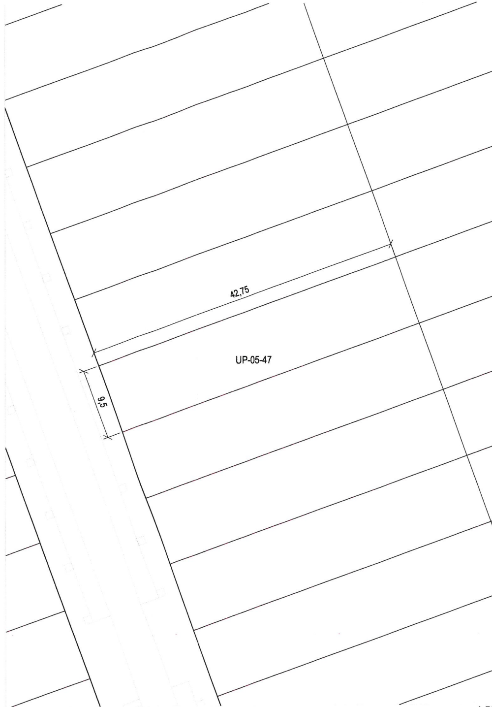
Plano de definición de la parcela