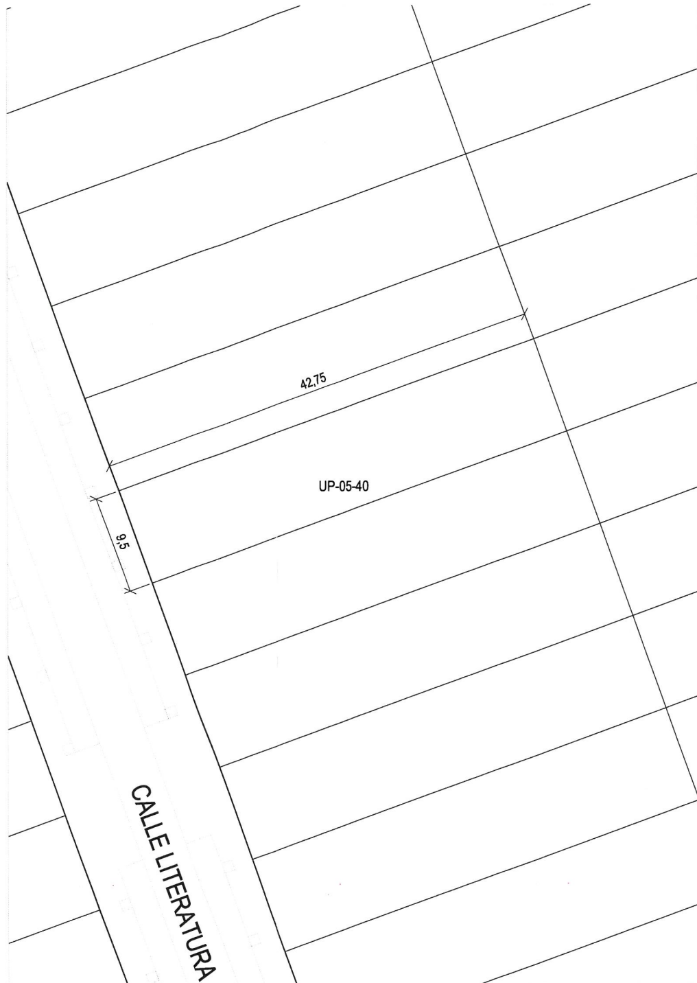
Plano de definición de la parcela