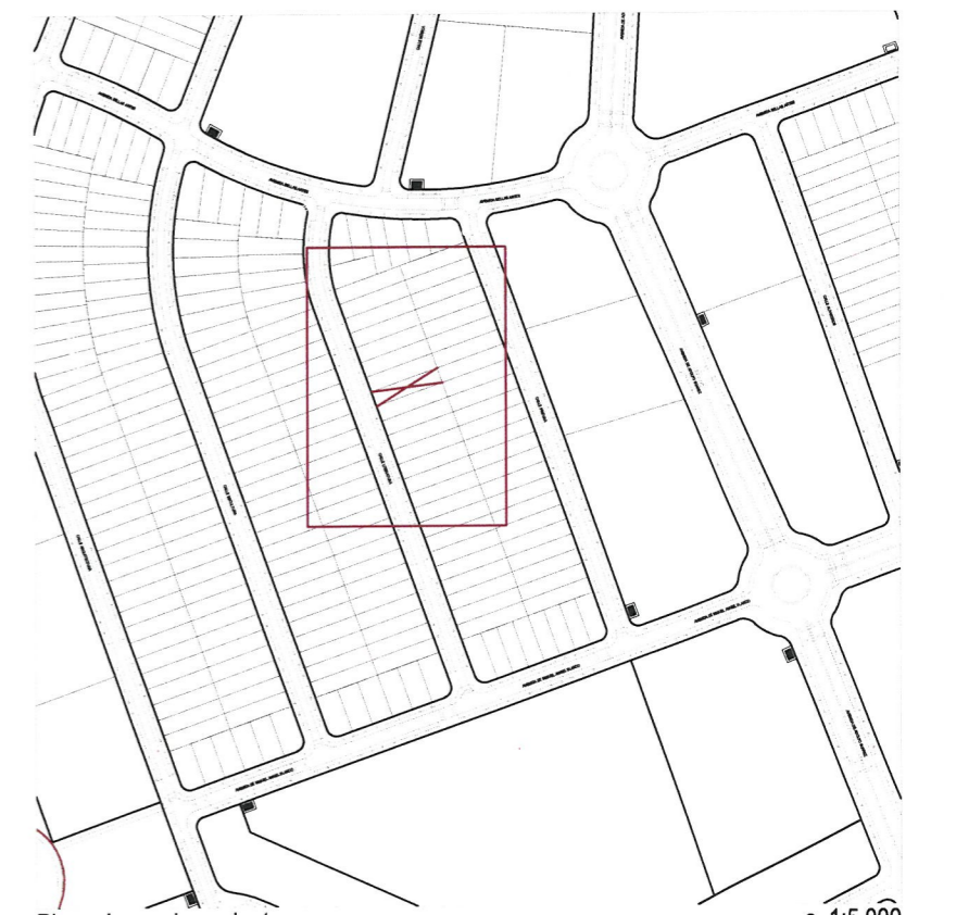
Plano de emplazamiento e. 1:5.000