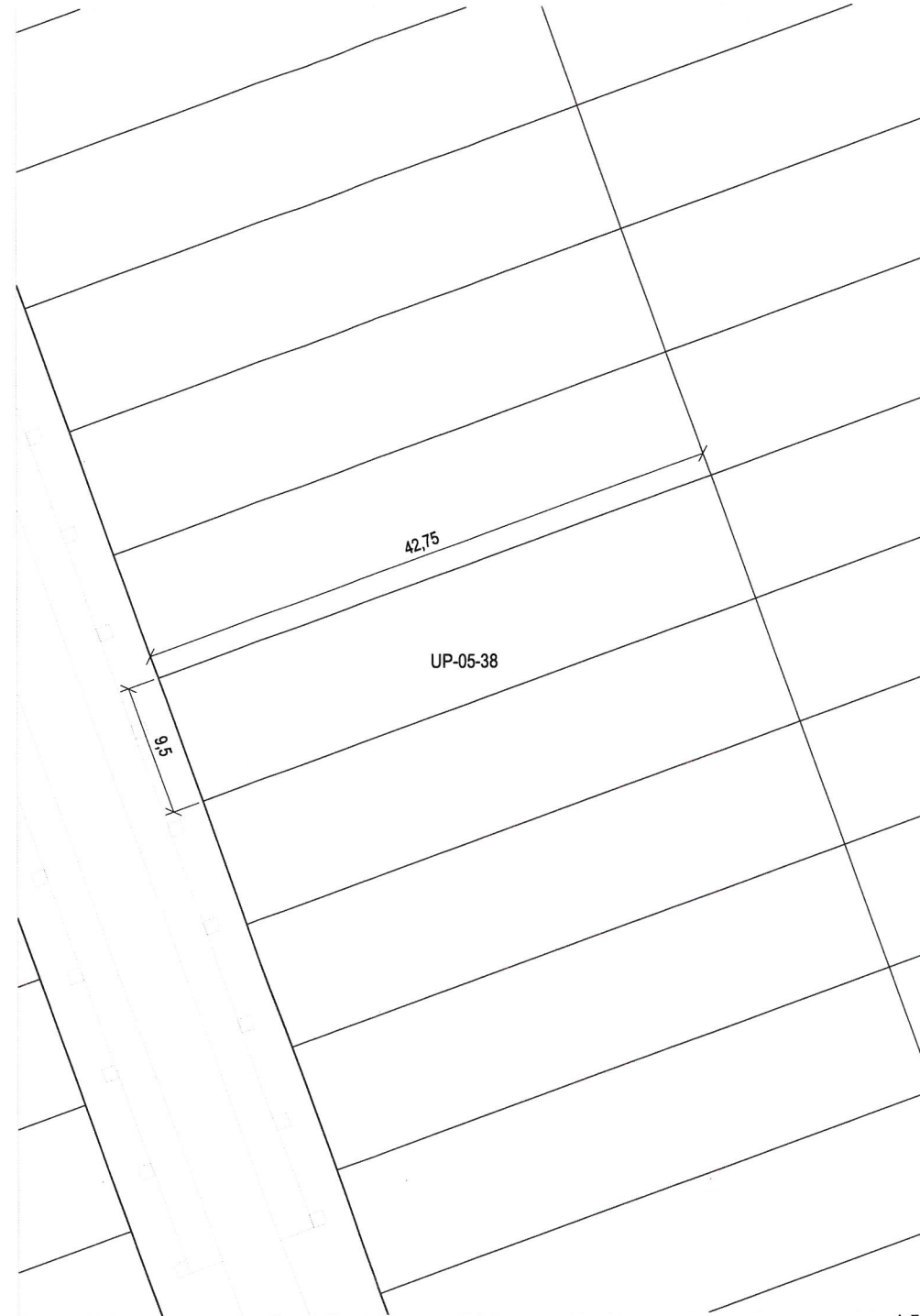
Plano de definición de la parcela