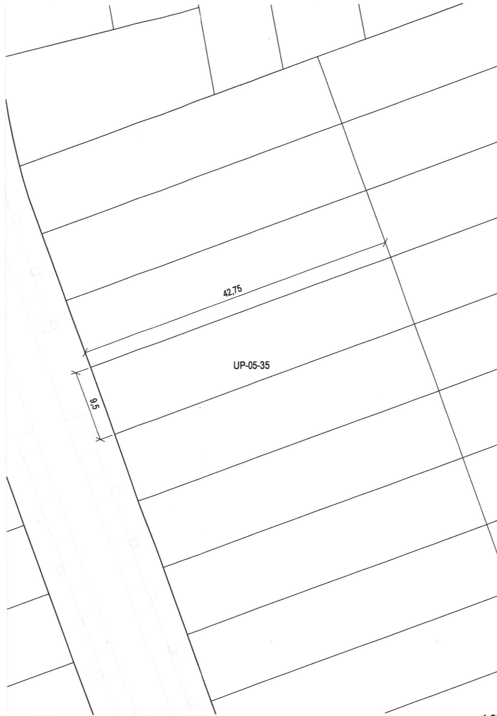
Plano de definición de la parcela