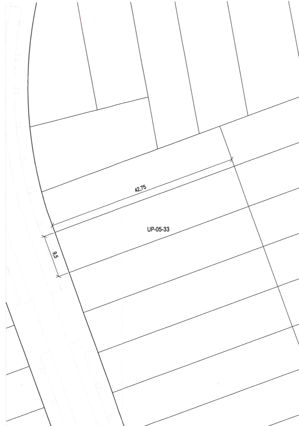
Plano de definición de la parcela